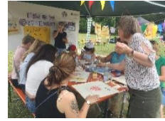
Stand der Regens-Wagner-Stiftung

Im Laufe des Seminars wurde mit zahlreichen externen Partnern zusammengearbeitet, wie beispielsweise dem bfz Parsberg, das für die Kochbuch-Zusammenarbeit den Kontakt zu Mitbürgern mit Migrationshintergrund herstellte, Grötsch Design , dem Eine Welt Laden Parsberg, dem Erlebnisbauernhof Eichenseer , der Freiwilligen Feuerwehr , der BRK Rettungshundestaffel , Regens Wagner , der Musikwerkstatt Frauenberg und vielen mehr.