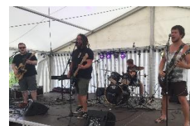
Auftritt der SOR-SMC-Patenband B.Trug

Die Besucher erwarteten zahlreiche Attraktionen für Jung und Alt sowie ein abwechslungsreiches Bühnenprogramm. Neben verschiedenen Verkaufs-/Essens- und Getränkeständen gab es auch zahlreiche Mitmachstationen sowie eine Ausstellung zum Thema Diskriminierung. Bei einer Tombola konnte man attraktive Preise gewinnen, die von verschiedenen Unternehmen aus der Region gespendet worden waren.