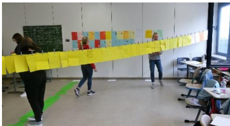
Überprüfen der Handlungsstränge

Eine besondere Herausforderung stellte die Tatsache dar, dass es sich um einen interaktiven Roman handelt, bei dem der Leser immer wieder selbst entscheiden kann, wie die Handlung weitergeht. Um alle Handlungsstränge und Wahlmöglichkeiten logisch miteinander zu verknüpfen, waren zahlreiche Absprachen und eine sehr enge Zusammenarbeit zwischen den Schülerinnen nötig.