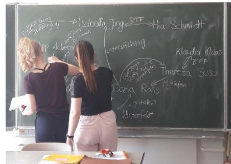
Erstellen der Figurenkonstellation

Um zu zwölf das Genre und die Handlung festzulegen, Charaktere zu entwickeln und schlussendlich allen Ideen Leben einzuhauchen, waren viel Ehrgeiz, Kompromissbereitschaft, Zeit und Geduld nötig. Am Ende hat sich der lange Weg aber gelohnt: Die Seminarteilnehmerinnen sind zusammen an ihren Aufgaben gewachsen, haben sich individuell weiterentwickelt, viele neue Erfahrungen aus dem Seminar mitgenommen und erfahren, was man als Team alles schaffen und verwirklichen kann.